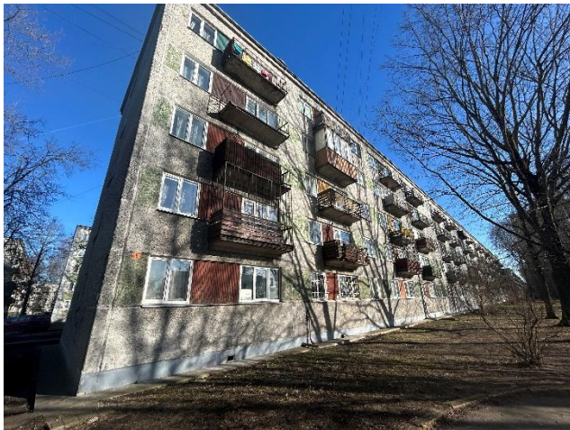
1. - 2. attēls. Ēkas fasādes.